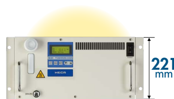
水冷式 800W, 1.2kW