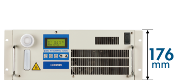
空冷式 200W, 400W, 510W