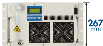
空冷式 800W, 1kW